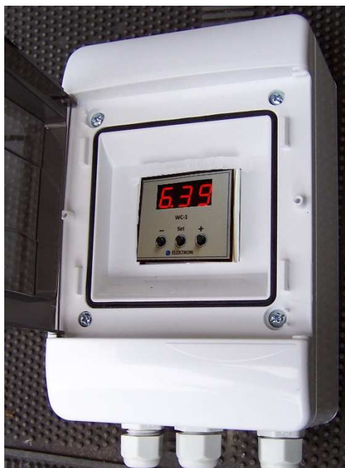
Opcja w obudowie ściiennej