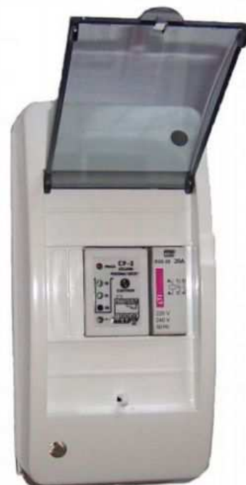
Rys.5 Zestaw CP-1F/ST zawierający czujnik CP-1F + stycznik do sterowania pompy 1-fazowej.