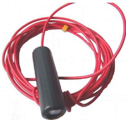
Rys. 3 Sonda konduktometryczna SW-1k/ X X- długość przewodu w [m] X= 3; 5;10;15.....100m

Do rurociągów ssawnych ( max. 10 bar) mogą być stosowane głowice ( G1; G-3A; G-3B lub G2 –rys.4) wykonane ze stali kwasoodpornej ( wkręcane w króciec z gwintem wewn. 1/2”). Szczegółowe dane techniczne w oddzielnej karcie katalogowej.