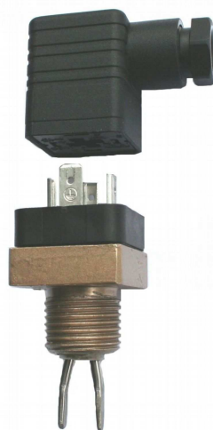
Rys. 4 Głowica G-3/A gwint 1/2"